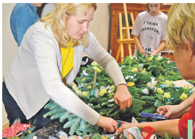
Tematyczne warsztaty, to jedna ze stałych pozycji w planach rad osiedlowych. Tu: bożonarodzeniowe ozdoby wykonywali mieszkańcy Krupińskiego.

Na działalność polkowickich rad osiedlowych w 2018 r. samorząd przeznaczył 1 mln 332 tys. 87 zł.