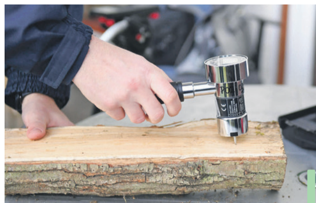
Strażnicy miejscy zmierzają wilgotność drewna za darmo.