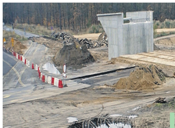
Według GDDKiA teraz na placu budowy trwa okres zimowy. Roboty – choć nie tak widoczne – są prowadzone.

Słaba mobilizacja wykonawcy, błędy w organizacji i koordynacji robót, zejście z placu budowy podwykonawców oraz konflikt pomiędzy współkonsorcjantami firmy Salini Polska a przedsiębior-