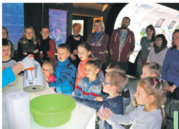
Jeśli któraś rada jeszcze nie zaprosiła swoich mieszkańców do wrocławskiego Hydropolis, to pewnie zrobi to w tym roku.