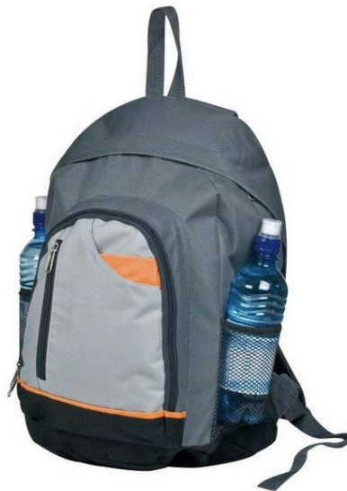
Lp. 15 – Plecak piknikowy